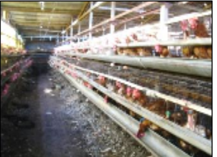
エコフィードとしてニワトリへ供給