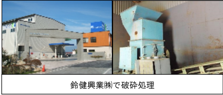
鈴健興業(株)で破碎処理