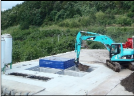
発酵槽に入れEM菌を散布(嫌気醗酵) (発酵槽は用途ごとに分かれている)