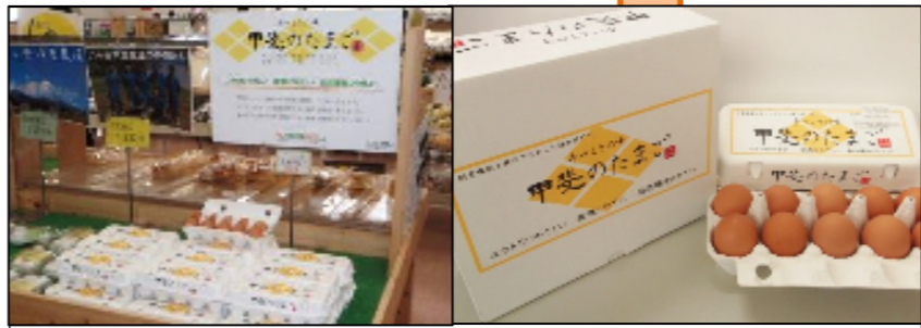
「甲斐のたまご」として流通 地域連携のイベントや販売所で販売している