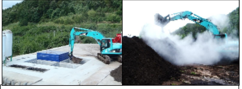
鶏糞はEM菌を散布し、発酵槽で嫌気醗酵させ、 お客様のニーズに合わせて堆肥にブレンド